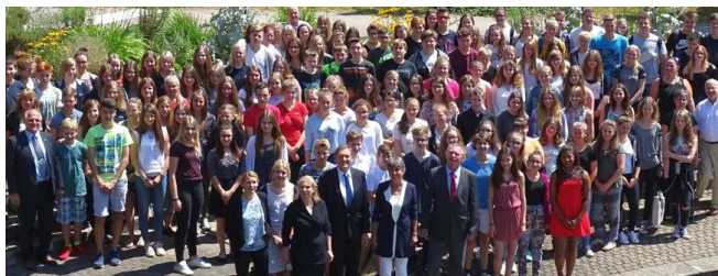
Zertifikatsverleihung 2016 im Landratsamt—Bayreuth

Freiwilligen Zentrum Bayreuth Am Schloßberglein 4 (1. OG) 95444 Bayreuth